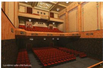
La même salle côté balcon.