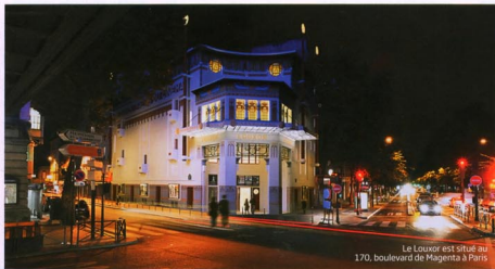
Le Louxor est situé au 170, boulevard de Magenta à Paris

Appartenant au groupe Fournier-Lutétia qui, à cette époque, jouait un rôle majeur dans l'exploitation cinématographique, cette gigantesque salle de 1 195 places devient la propriété de Pathé en 1929. Le cinéma parlant commence alors à donner de la voix, et Pathé négocie habilement le virage. L'établissement se transforme également, à l'occasion, en scène musicale, où se produira Dizzy Gillespie et où débute le fringant Gilbert Bécaud. Rien que ça ! Bref, durant les premières décennies, le succès ne s'interrompt pas. C'est à la fin des années 50 que tout va commencer à se gâter.