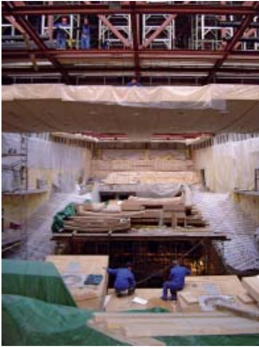
Alle wand- en plafondelementen zijn als bouwpakket in slechts drie maanden gemonteerd.