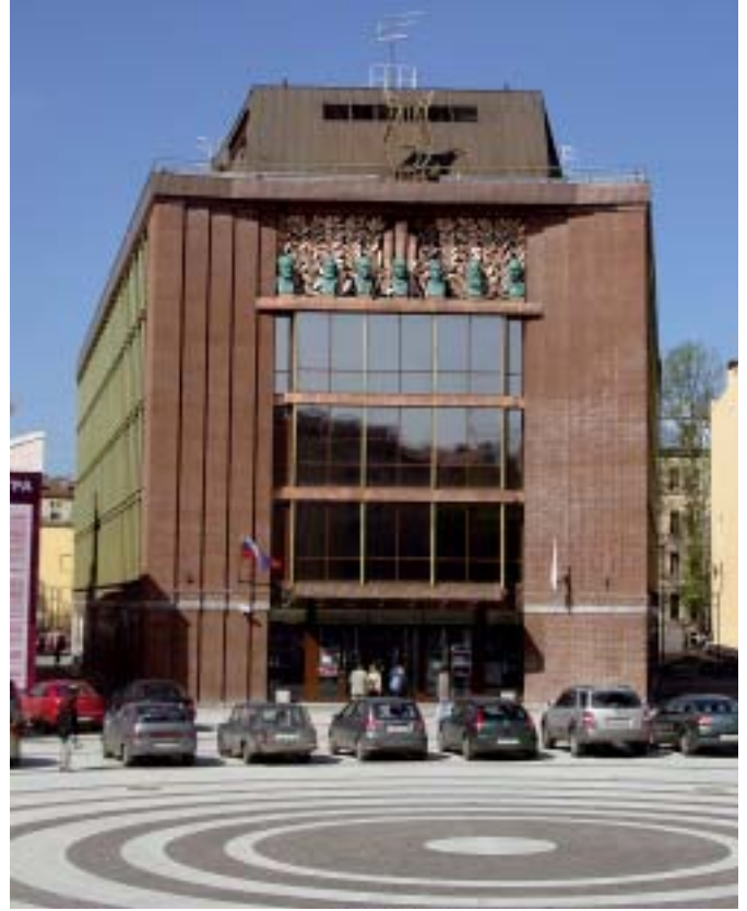
De renovatie/nieuwbouw van het concertgebouw is een mix van 19e en 21ste eeuw.