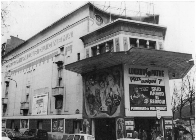
Le Louxor dans les années 70 à l'heure du cinéma permanent. À l'affiche, des films souvent arabes, parfois égyptiens. Ici l'acroche promet : « Un grand film de l'Islam ».

égyptiennes ne vient pas du cinéma, elle s'inscrit dans un courant plus vaste d'égyptomanie. Ce courant qui commence au XVIII e siècle s'est nourri d'événements historiques : Bonaparte, Champollion, la découverte des hiéroglyphes, du tombeau de Toutankhamon. En Angleterre, dès 1812, l'Egyptian Hall accueille des expositions avant d'être le lieu de la première projection de cinéma à Londres, quelques années avant sa destruction en 1904. Aux États-Unis cela commence au XIX e . On trouve de tout y compris des tombes égyptiennes ou des entrées de cimetières qui ressemblent à des façades de cinéma. Pendant les années folles, il y a des paquebots à l'égyptienne et on trouve des salons égyptiens dans les grands hôtels.»