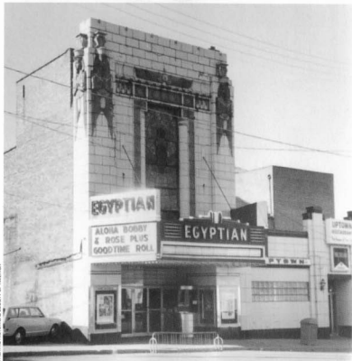
THEATRE HISTORICAL SOCIETY OF AMERICA

Ci-dessus : Le Carlton (1928), dans la banlieue de Londres, est surplombé par le « disque ailé », que l'on retrouve décliné au Louxor trois fois en haut de la façade et, en fer forgé, trois fois au-dessus du hall d'entrée. Sa façade a été détruite par les bombes en 1945.