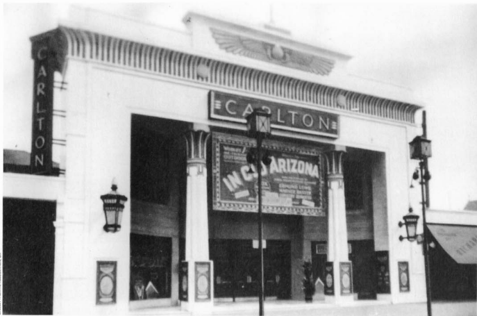
CINEMA THEATRE ASSOCIATION, UK